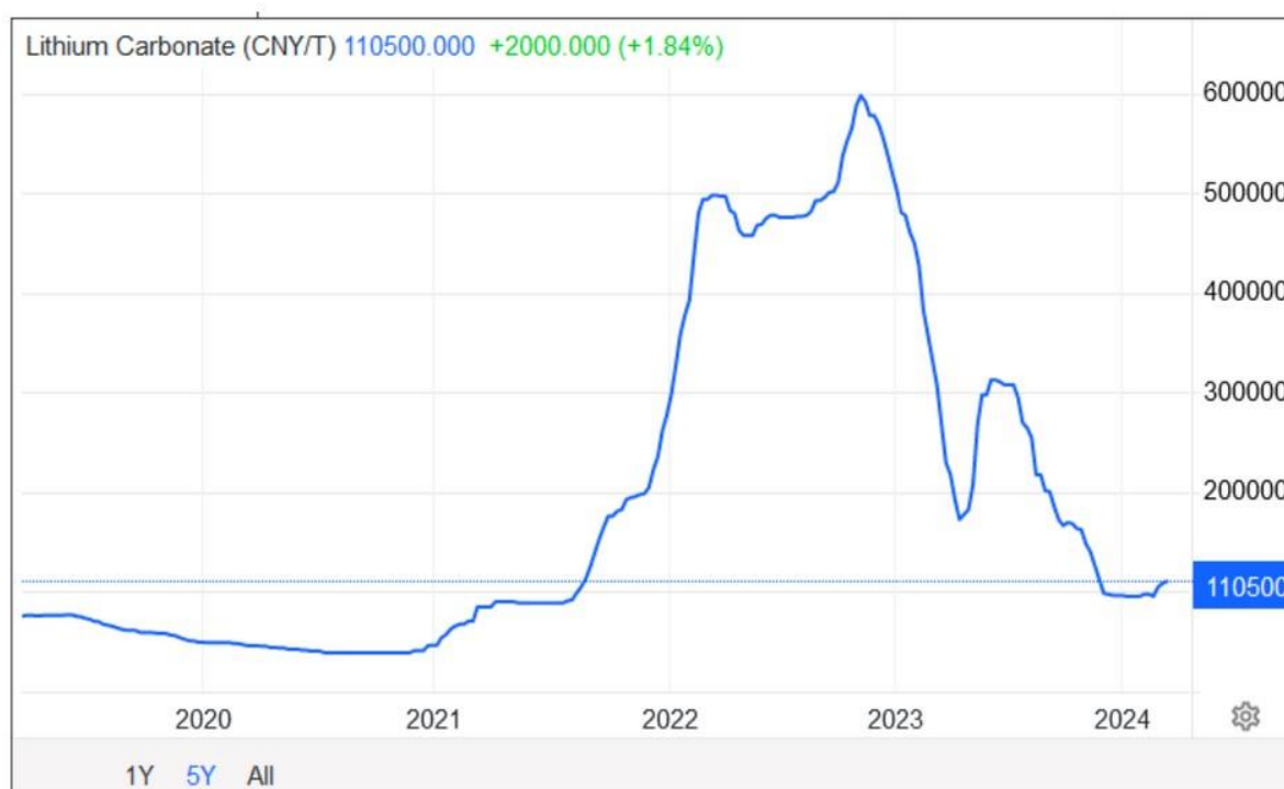
Figure 2. Variations des cours mondiaux du carbonate de lithium