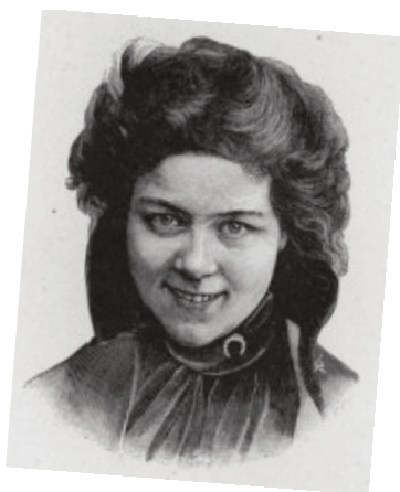
Loïe Fuller vers 1900

et Gabrielle (ndlr : elles sont assises l'une à côté de l'autre sur un banc et discutent des brevets de Loïe... c'est en effet limpide comme représentation du couple).