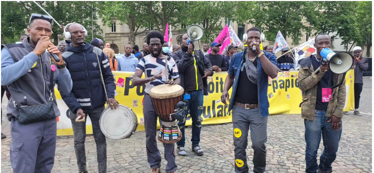
Face à leur exploitation, les travailleurs Sans papiers du piquet de Chronopost d'Alfortville se battent depuis 30 mois pour leur régularisation.